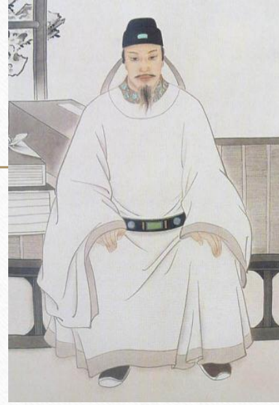
徐光启、李之藻、杨廷筠 圣教三柱石