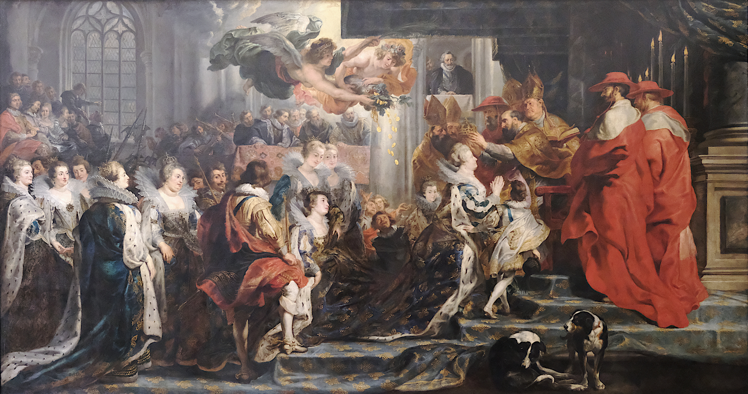
玛丽美第奇的加冕 1621 法国巴黎卢浮宫