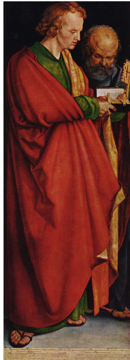
四使徒 1526 慕尼黑 老绘画陈列馆