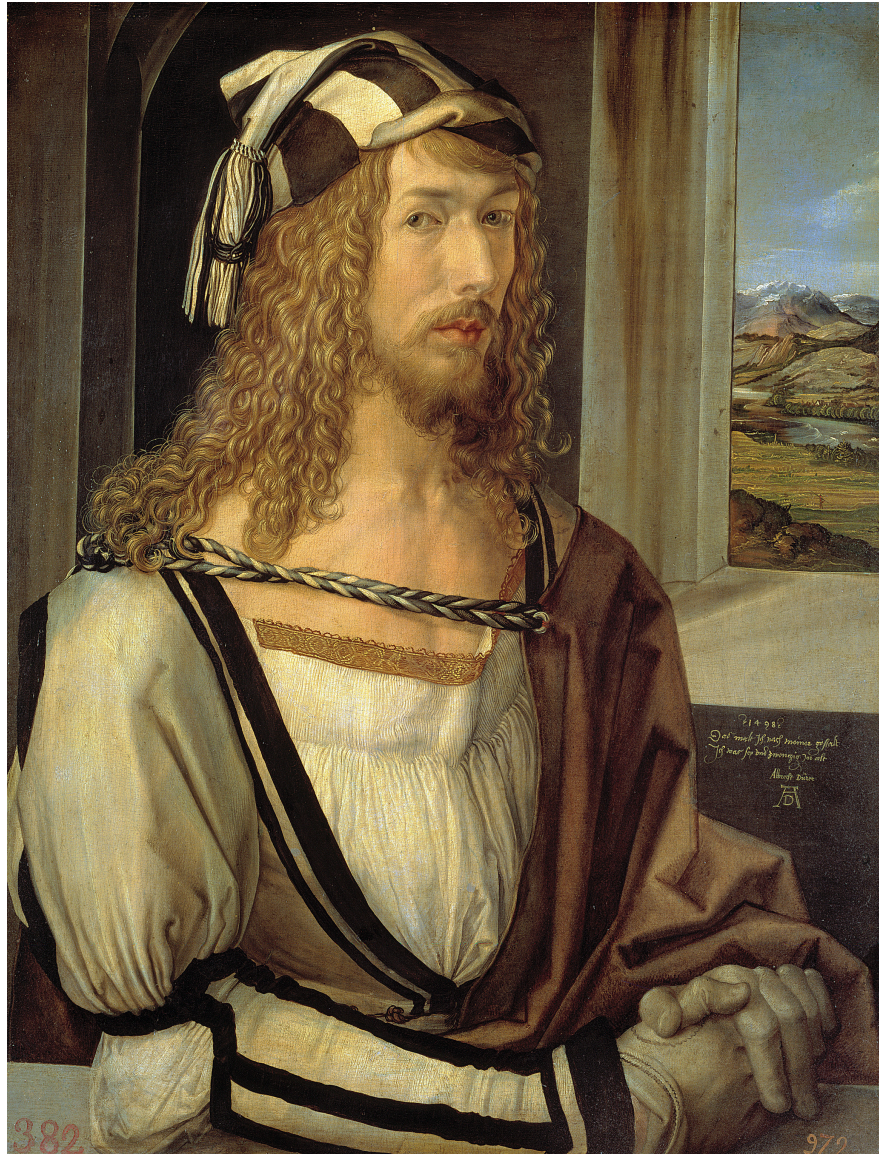
左：1498 马德里 普拉多博物馆 Prado Museum