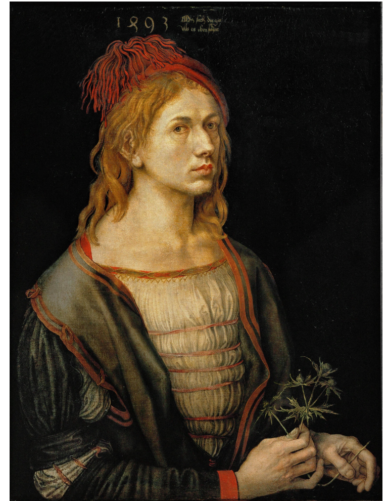
右：自画像 1493 巴黎 卢浮宫