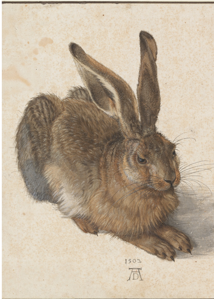
兔子 1502 维也纳 阿尔贝蒂娜 博物馆