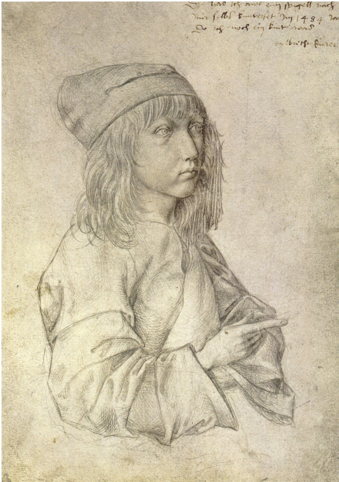
左：自画像 1484 维也纳 阿尔贝蒂娜 博物馆 Albertina Museum