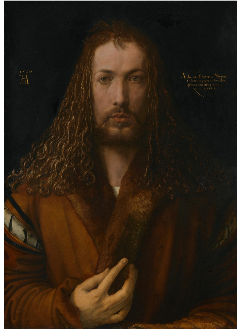
右：1500 慕尼黑 老绘画陈列馆 Alte Pinakothek