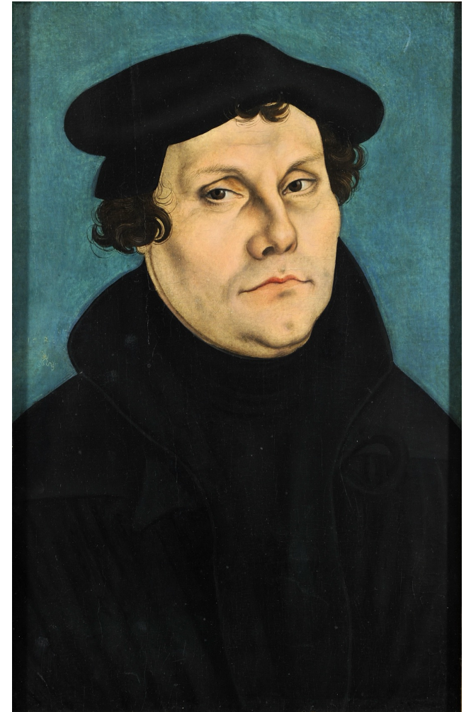
右：马丁路德 Martin Luther ( 1483-1546 )