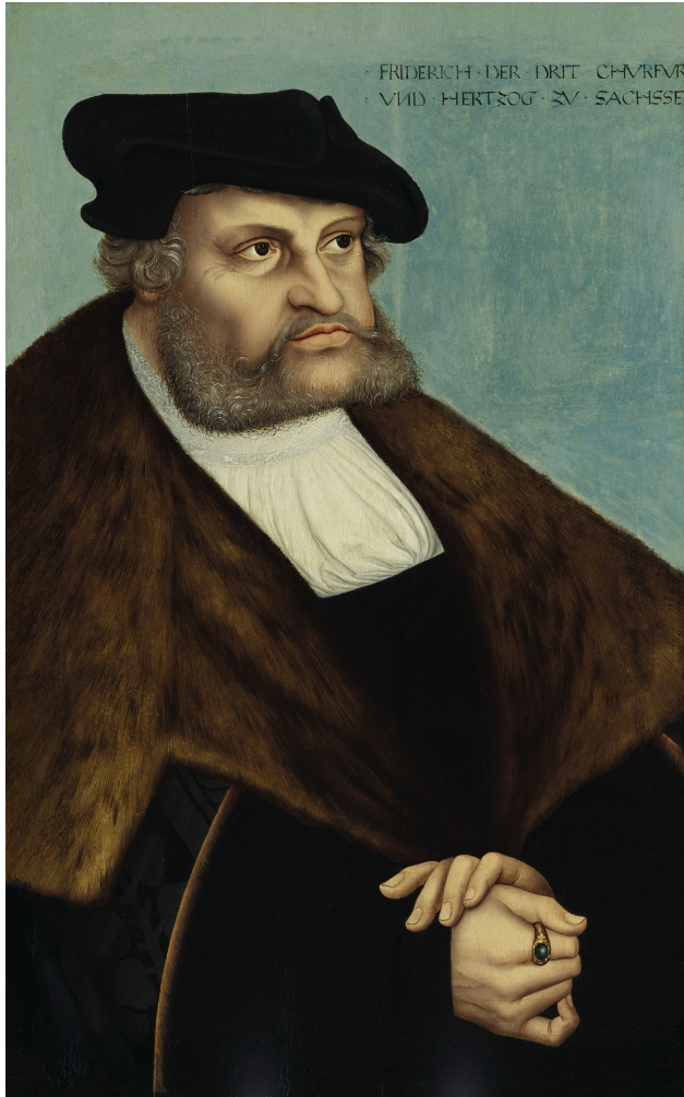
左：弗里德里希三世 Friedrich III ( 1463-1525 ) 萨克森选帝侯