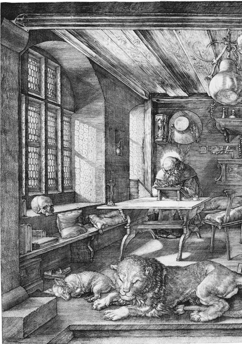
书房中的 圣耶柔米 1514 纽约 大都会博物馆