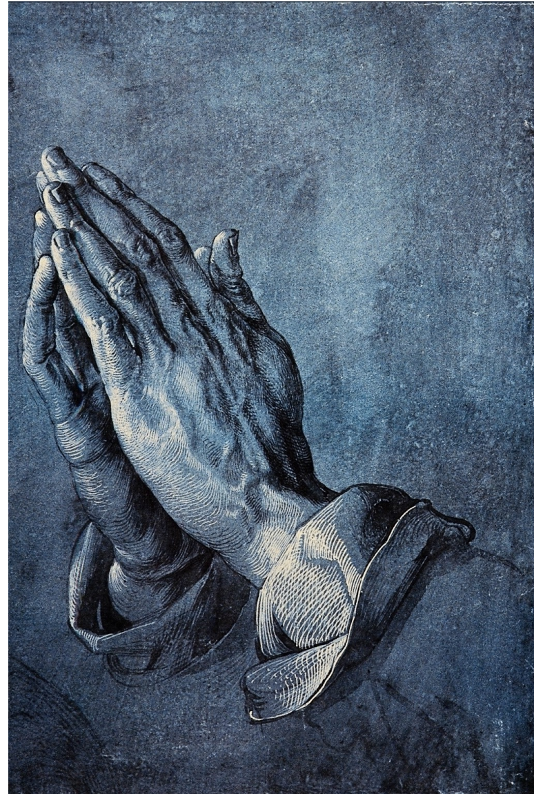
祈祷的手 1508 纽约 大都会博物馆