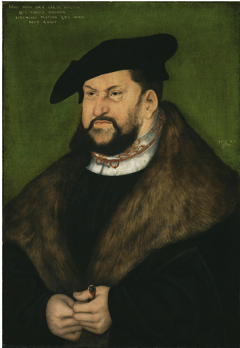
左: 坚定者约翰 John the Steadfast ( 1468-1532 ) 克拉纳赫 1526年所画