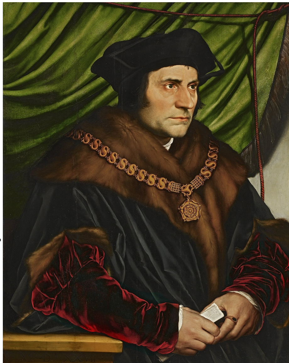
右：1527 托马斯·摩尔 纽约 弗里克收藏馆 Frick Collection