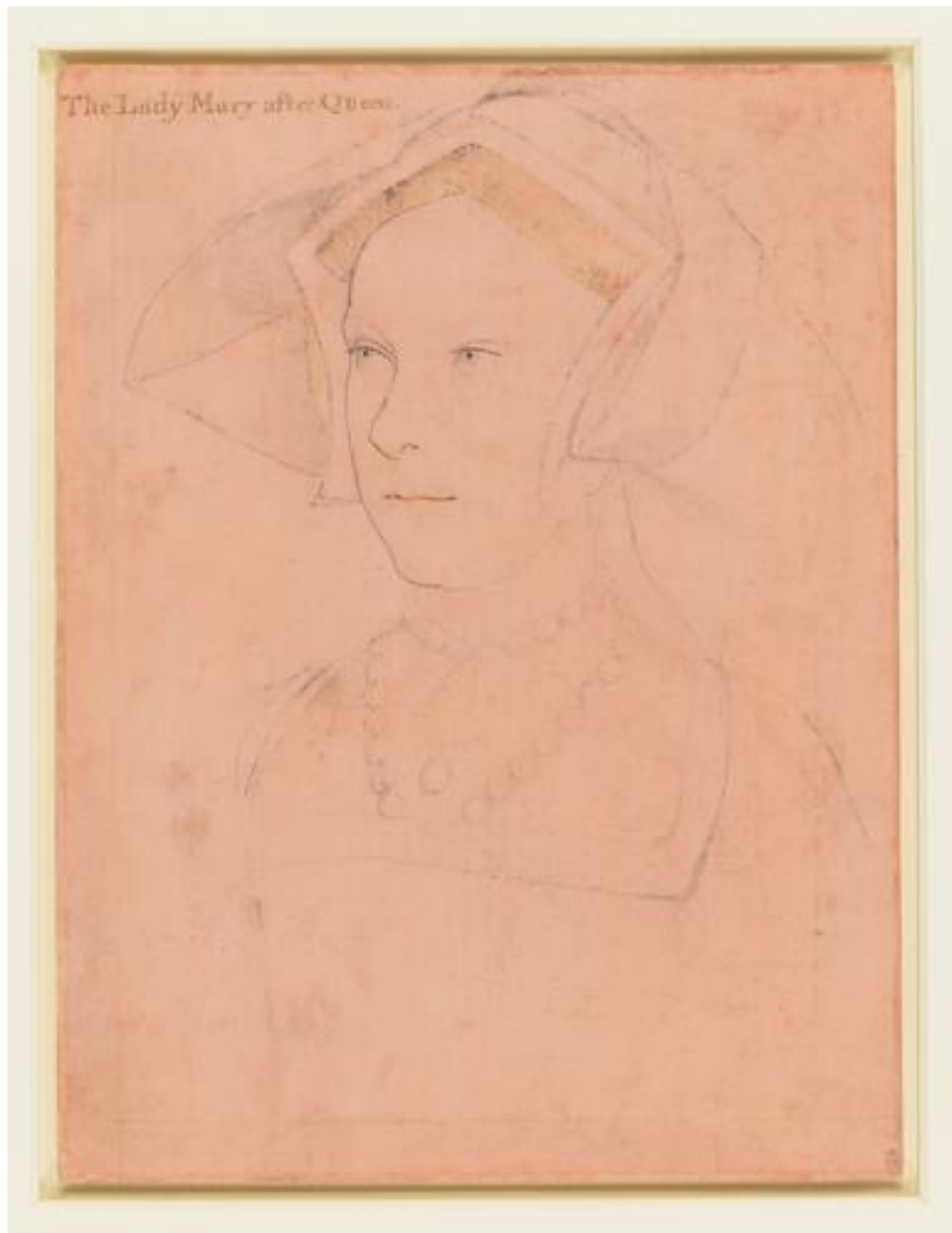
左：1537 玛丽公主 1516-1558