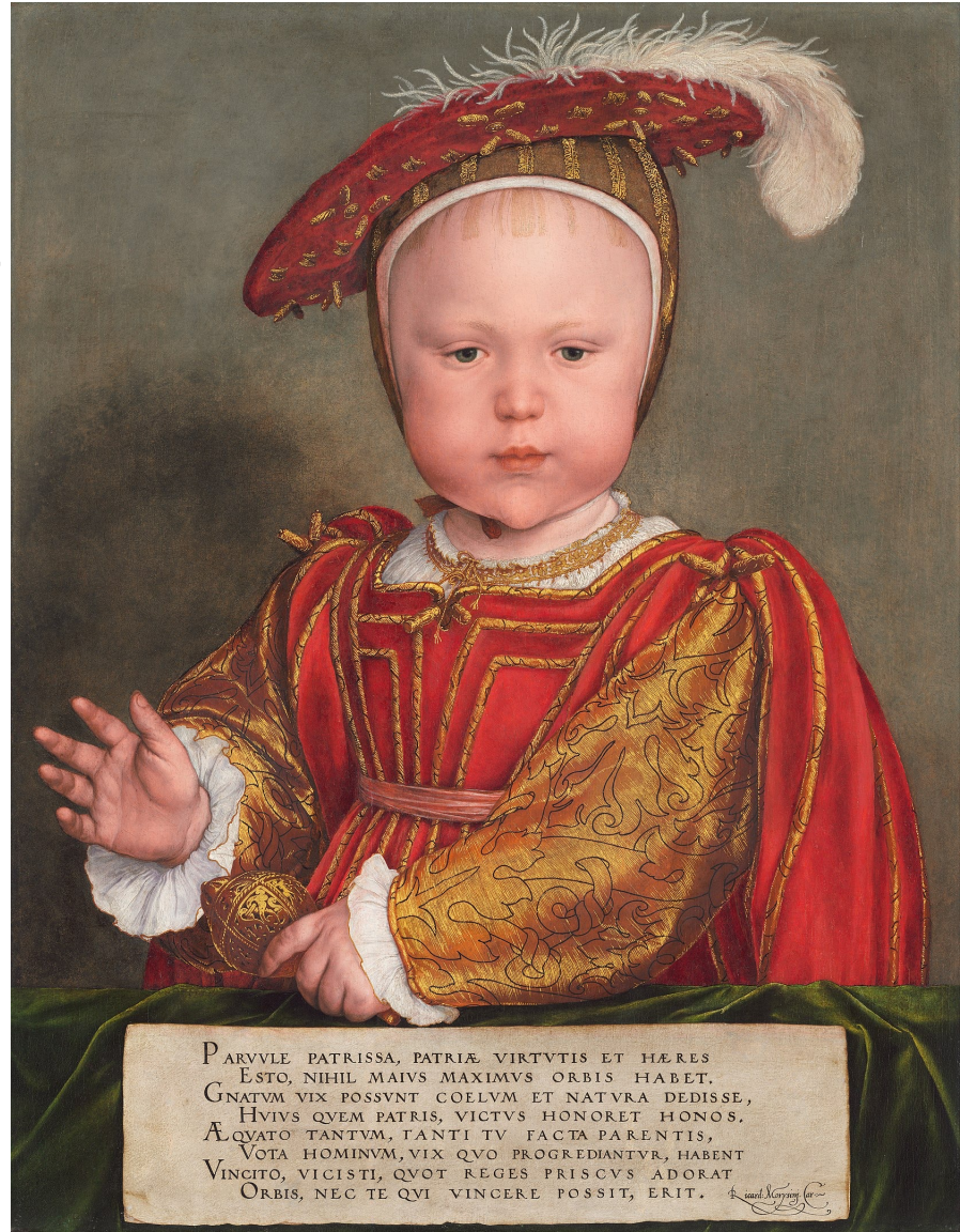
右：1539 爱德华六世 华盛顿 国家艺术画廊