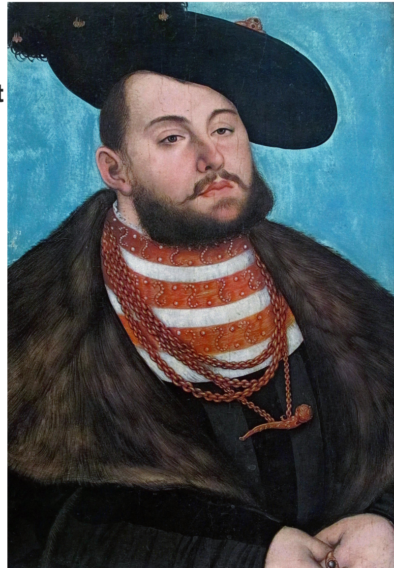
右: 腓特烈一世 (宽宏者腓特烈) John Frederick I ( 1503-1554 ) 克拉纳赫 1531年所画