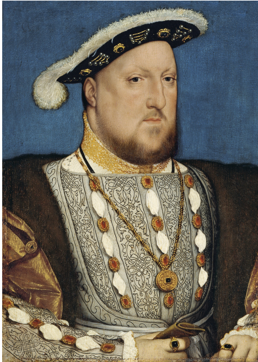
左：1536 亨利八世 西班牙 提森-博内米萨 博物馆 Thyssen- Bornemisza Museum