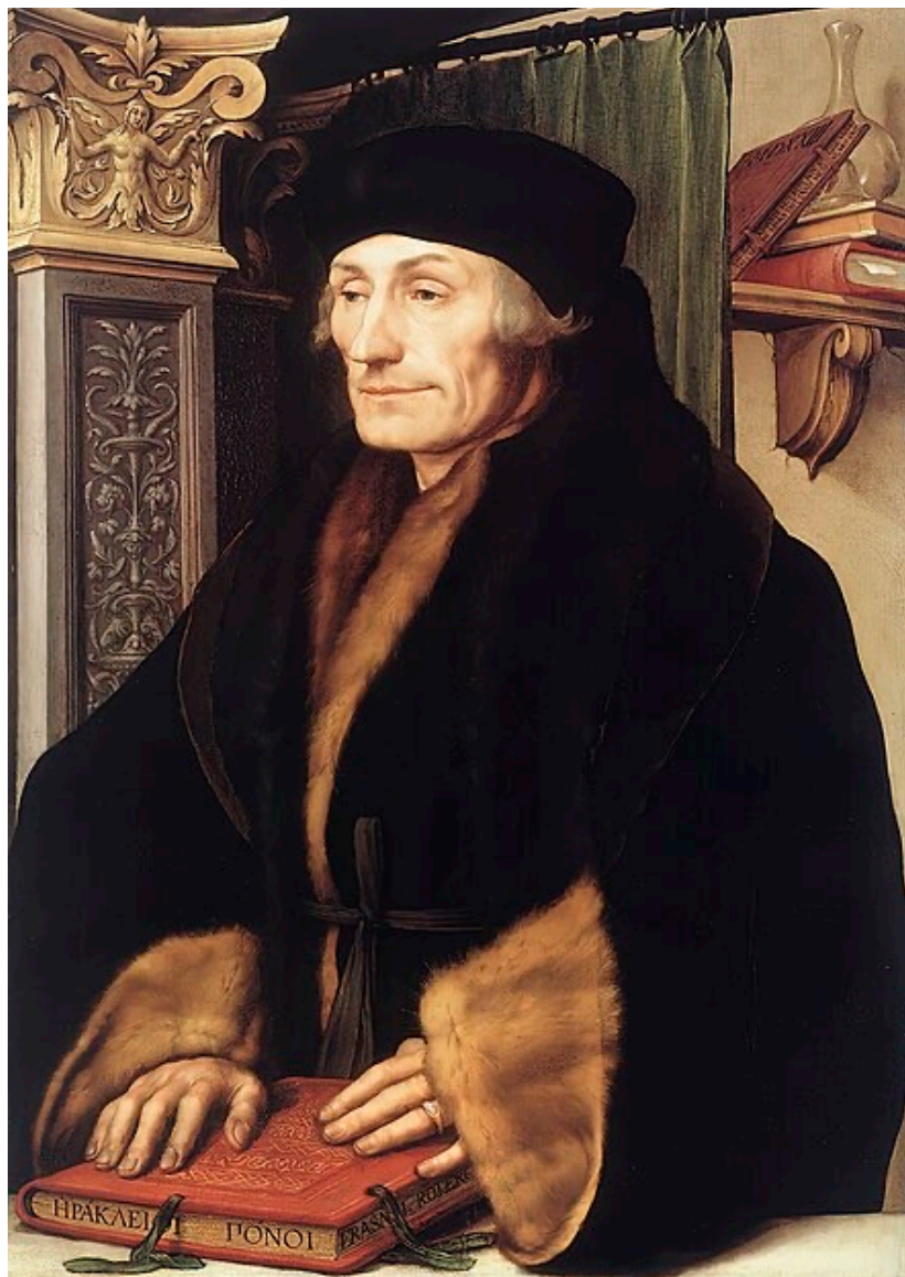
左：1523 伊拉斯谟 伦敦 国家美术馆 National Gallery