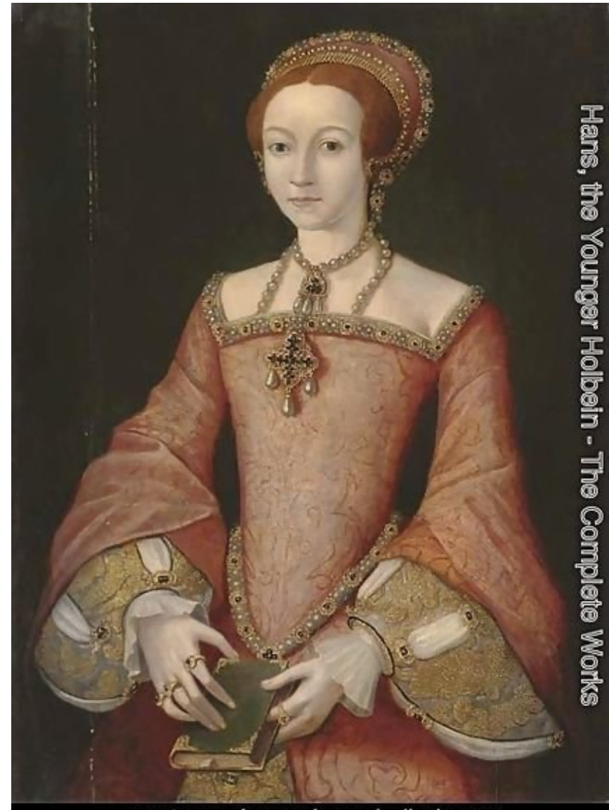
右： 伊莉莎白 公主 1533-1603