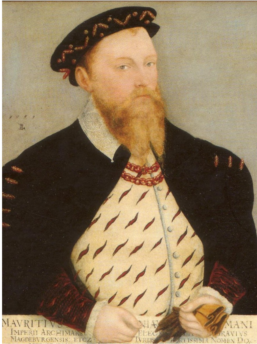
莫里茨 Maurice 1521-1553